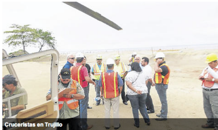
Crucelistas en Trujillo

Podrían incluir a esta ciudad dentro de su ruta turística, pero evalúan aspectos como la seguridad.